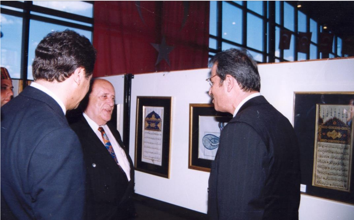
Edirne Trakya Üniversitesi Sabancı Kültür Sitesi Osmanlı Devleti'nin 700. Kuruluş Yıldönümünde Vakfiyelerdeki Türk Süsleme Sanatları Sergisini Reiscumhurumuz Sayın Süleyman Demirel gezerken Sadi Bayram bilgi sunuyor.